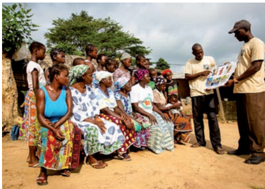
Une activité de sensibilisation communautaire sur le travail des enfants.

Nous avons élargi notre système de surveillance et de remédiation du travail des enfants au sein des communautés en passant de 8