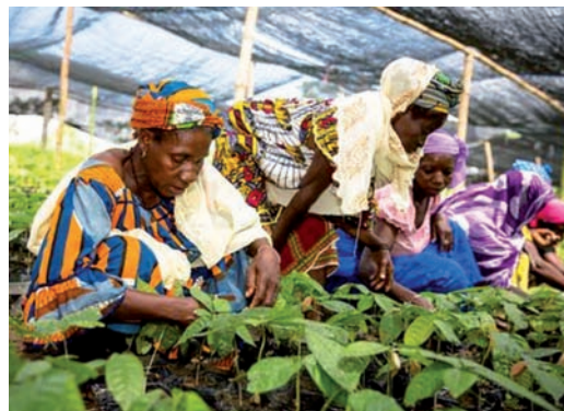
Des femmes productrices de cacao assurant l'entretien de leur pépinière offerte par Nestlé.

Au cours de l'année 2014, le nombre de femmes qui dirigeaient et surveillaient les pépinières communautaires installées dans le cadre du plan cacao de Nestlé est passé de 3% à 23%. Quatre sessions de formation sur le leadership féminin ont été organisées dans notre station expérimentale à Zambakro. Aussi, nous avons déjà commencé à assister des associations de femmes au sein des communautés de producteurs de