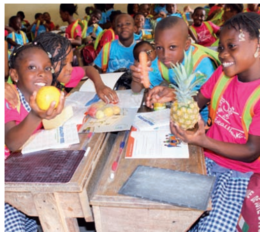
Une séance sur le cours Healthy Kids.

Plus de 30 acteurs du système éducatif ivoirien constitués d'inspecteurs de l'enseignement primaire, de conseillers pédagogiques, de directeurs d'écoles et d'enseignants ont été formés pour assurer une meilleure mise en œuvre du programme « Healthy Kids » dans les écoles.