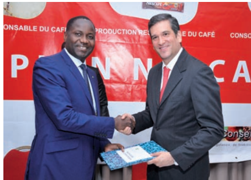
La signature de la convention sur le Plan Nescafé avec le Ministre de l'Agriculture Mamadou Sangafowa Coulibaly et le Directeur Général de Nestlé Côte d'Ivoire, Mauricio Alarcón.

Le Plan Nescafé est notre initiative dédiée à la caféiculture. Ce programme mondial a été lancé officiellement en Côte d'Ivoire depuis le mois de novembre 2014 lors d'une cérémonie de signature d'une convention cadre avec le ministère de l'agriculture.